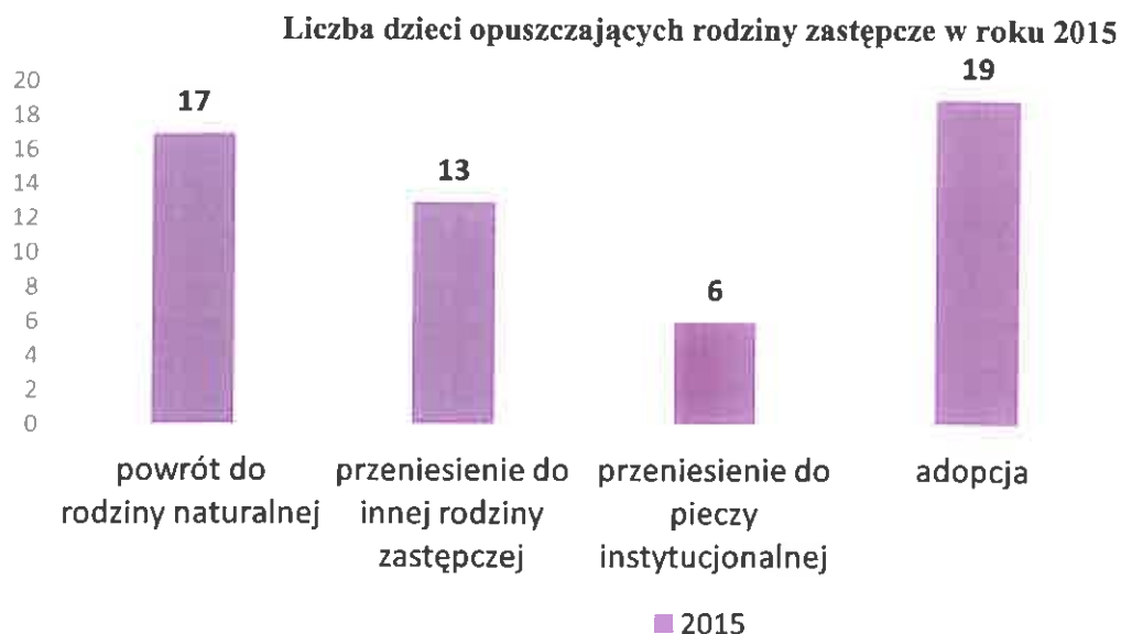
Wykres 2. Liczba dzieci opuszczających rodziny zastępcze w roku 2015

W 2015r., rodzinną pieczę zastępczą opuściło 55 dzieci. Poniższa tabela prezentuje powody opuszczenia przez dzieci rodzinnej pieczy zastępczej w 2015 roku.